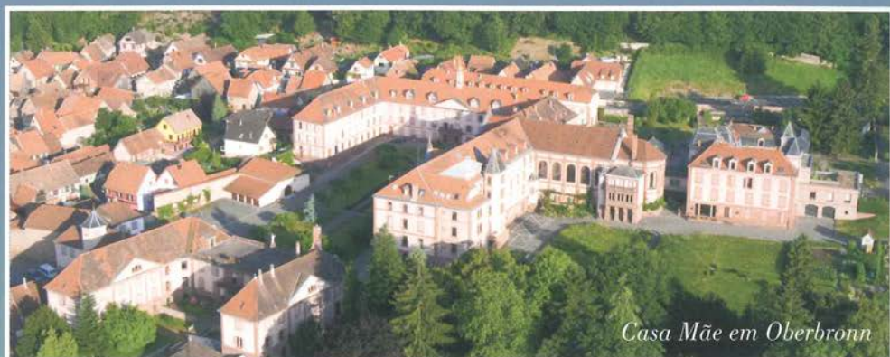
Casa Mãe em Oberbronn

Todas essas Congregações consideram esta palavra da Regra Primitiva como uma afirmação fundadora: